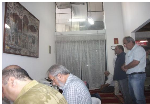
Foto: Oração na Associação Beneficente Islâmica