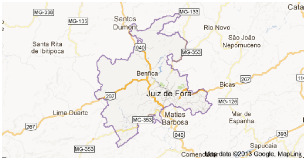
Mapa 4: Juiz de Fora