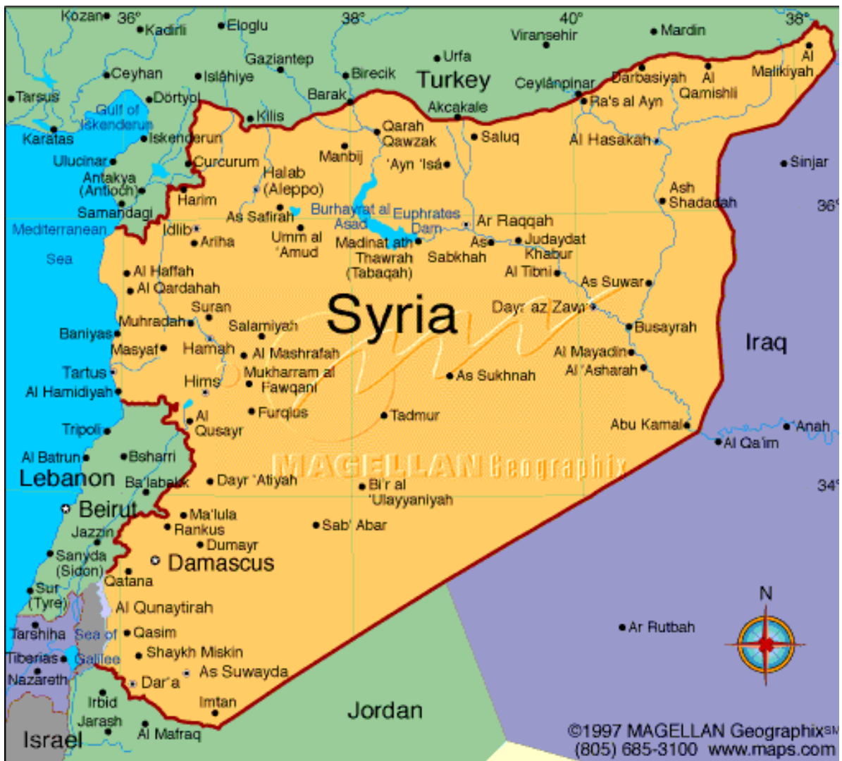
Mapa 1: Síria