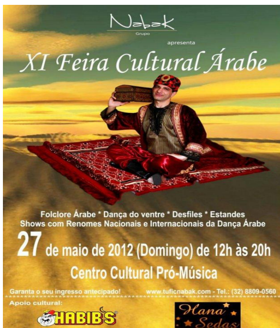
Foto: Cartaz de divulgação da XI Feira Cultural Árabe, em 2012 45