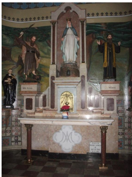
Foto: Altar maronita na Igreja Católica São Sebastião ofertado pela colônia libanesa de Juiz de Fora.

No contexto de sua fundação, a Igreja Melquita de São Jorge era um espaço quase exclusivo dos sírios (em sua maioria de Yabroud), visto que poucos libaneses frequentavam o local. A maioria dos libaneses de Juiz de Fora eram maronitas, e devido às suas rivalidades políticas e identitárias com os melquitas nos países de origem, estes imigrantes, por não terem um templo próprio, preferiam frequentar as igrejas católicas da cidade, principalmente a Igreja São Sebastião. 56 Entretanto, nas narrativas dos imigrantes tanto sírios quanto libaneses a Igreja Melquita é considerada uma realização de sua comunidade, independente de suas diferenças nacionais.