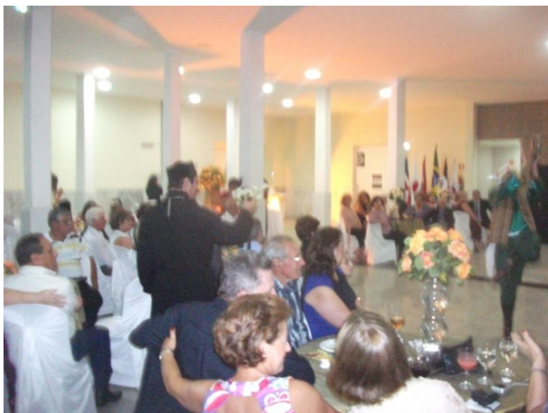
Foto: Ar. João Carlos fotografando a apresentação do Grupo Nabak. (Arquivo pessoal)

Por outro lado, a participação desse pároco no jantar ainda apresenta mais uma dimensão analítica: a reafirmação do vínculo entre a identidade melquita e a etnicidade árabe. Considerando que ele é um padre brasileiro sem origem árabe, e nas cerimônias religiosas regulares da igreja a presença árabe é escassa, eventos sociais dessa natureza, em que a comunidade árabe está reunida, é uma oportunidade interessante para reforçar essas conexões e trazer esses fiéis para uma prática constante da religiosidade melquita no espaço da Paróquia.