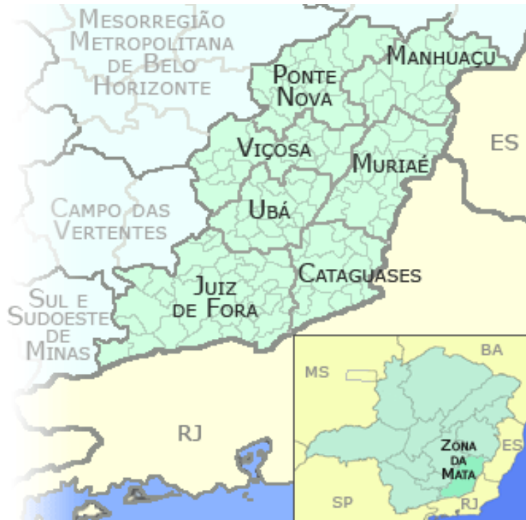
Mapa 3: Zona da Mata Mineira