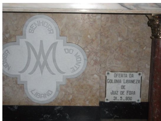
Foto: Parte inferior ampliada da foto acima