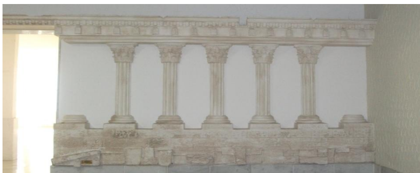
Foto: situada no hall do clube, esta obra, que foi feita pela artista plástica Marta Lisboa, evoca as ruínas de Baalbek do Líbano.

O Clube Sírio e Libanês de Juiz de Fora, localizado na Avenida Rio Branco foi criado em 18 de setembro de 1964 pelos imigrantes árabes e seus descendentes durante um encontro realizado no Raffa's Club 19 . A iniciativa surgiu do interesse em construir um espaço de sociabilidade e lazer tanto para os membros da comunidade árabe quanto para os cidadãos juiz-foranos.