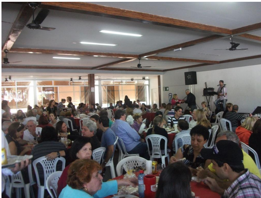
Foto: Almoço Beneficente para a Construção da Igreja Maronita de São Charbel.

comunidade árabe, mais uma vez percebemos em relação a culinária, a confluência entre diacríticos culturais árabes e elementos da cozinha local, demonstrando assim as relações de continuidade e descontinuidade cultural que tem marcado a presença árabe em Juiz de Fora.