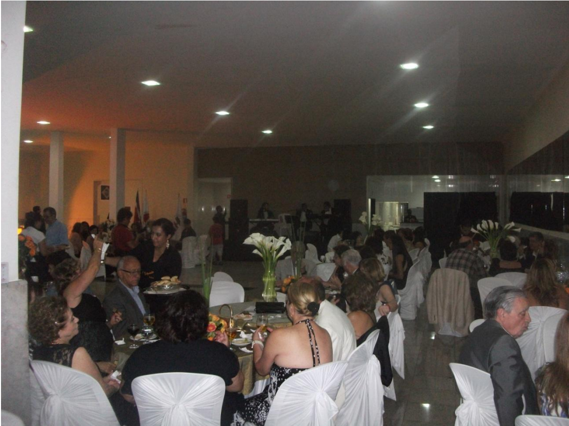
Foto: Jantar Anual do Clube Sírio e Libanês, 2012.