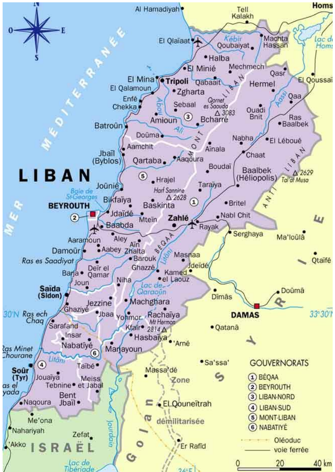
Mapa 2: Líbano