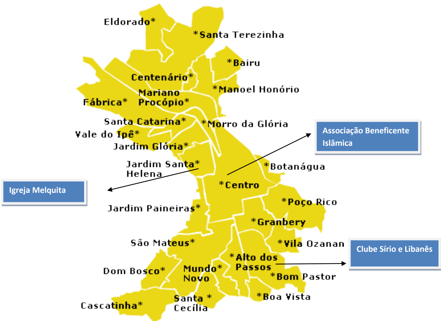
Mapa 5: Juiz de Fora