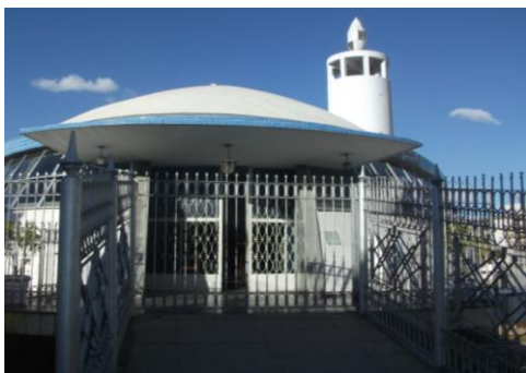
Foto: Entrada da Igreja Melquita

No capítulo anterior, demonstramos a importância do Clube Sírio Libanês, do Grupo Nabak e dos restaurantes para o processo de afirmação da etnicidade árabe em Juiz de Fora. Entretanto, esses não são os únicos espaços étnicos dos imigrantes árabes e seus descendentes, já que a construção de instituições religiosas também são características marcantes da presença árabe nesta cidade. Diante disso, o que será argumentado no capítulo que segue, é que a Igreja Católica Melquita de São Jorge e a Associação Beneficente Muçulmana servem tanto como locais de culto quanto arenas de construção e afirmação de identidades étnicas, nacionais e locais, que se articulam em diferentes níveis e formas com as identidades religiosas.